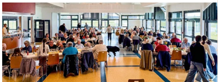
Repas à la salle socio-culturelle d'Eckwersheim le Jeudi de l'Ascension le 14 mai

Jeudi de l'Ascension, le 14 mai a eu lieu la fête paroissiale avec un culte à l'église à 10h15 suivi d'un repas convivial à la salle socioculturelle d'Eckwersheim avec au menu un cochon de lait. Une belle réussite pour cette rencontre festive : 104 repas ont été servis dans la salle et 17 repas ont été servis en « click and collect ». Merci au « Potager de Baptiste » pour les légumes. Toute l'assiette du repas était faite maison : le cochon de lait, les crudités, le fromage et les desserts. Un grand merci pour la participation de tous à ce moment convivial.