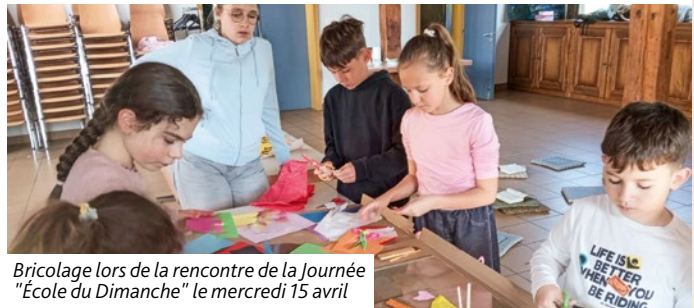
Bricolage lors de la rencontre de la Journée "Ecole du Dimanche" le mercredi 15 avril