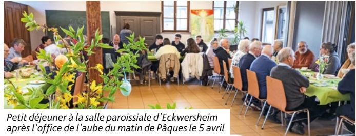
Petit déjeuner à la salle paroissiale d'Eckwersheim après l'office de l'aube du matin de Pâques le 5 avril