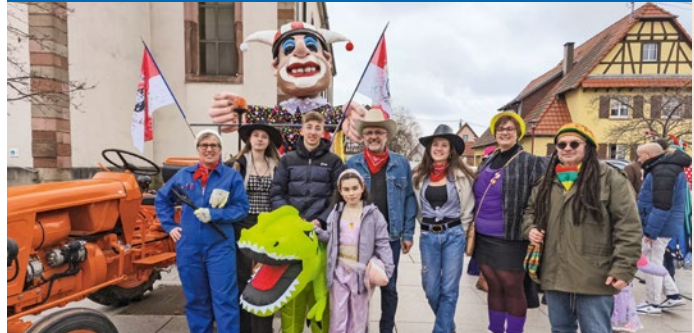
Paroissiens déguisés au culte du carnaval de Hoerdt le dimanche 15 février