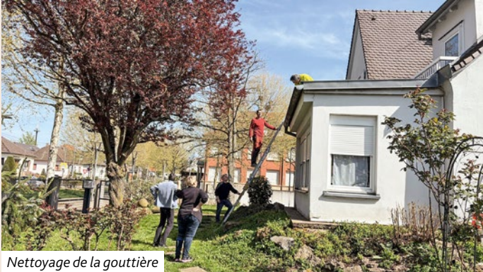
Nettoyage de la gouttière

Le samedi 11 avril, sous un soleil radieux et dans une ambiance chaleureuse, un groupe de bénévoles de la paroisse s'est réuni à l'église pour nettoyer les vitres et les placards, et effectuer quelques petites réparations. Parallèlement, un autre groupe de bénévoles, composé de membres de la paroisse et du consistoire, s'est retrouvé au presbytère afin d'y réaliser divers travaux : nettoyage des dalles de l'entrée, de la gouttière et des vitres. Au jardin, la pelouse a été tondue et une plate-bande désherbée. Après l'effort, le réconfort : cette matinée de travail s'est conclue par un moment convivial autour d'un apéritif. Nous adressons nos chaleureux remerciements à toutes les personnes présentes ce jour-là et vous donnons d'ores et déjà rendez-vous à l'automne pour une nouvelle édition !