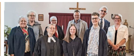
Les confirmands de Kurtzenhouse, avec les membres du Conseil presbytéral