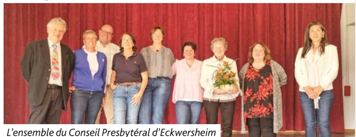
L'ensemble du Conseil Presbytéral d'Eckwersheim