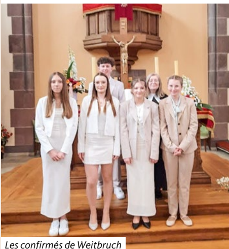
Les confirmands de Weitbruch

Des cultes de fête, vécus en communion entre nos villages, pour témoigner de ce Dieu qui accompagne nos chemins et donne force et espérance pour vivre et annoncer l'Évangile.