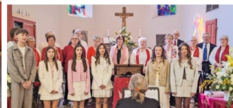
Les confirmands de Gries avec la Chorale