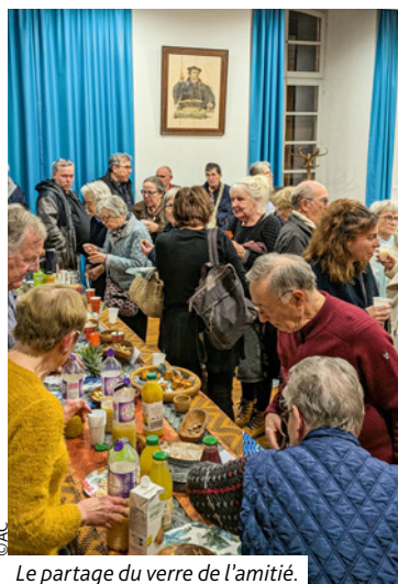
Le partage du verre de l'amitié.

La Journée mondiale de prière a réuni des paroissiens des communautés catholique, protestante et évangélique, le vendredi 6 mars dernier à la Salle Schweitzer de l'église protestante de Brumath. Cette année le Nigéria était à l'honneur, et la cérémonie avait été préparée par un groupe de femmes chrétiennes nigérianes et portée par des bénévoles de nos paroisses. Après le temps