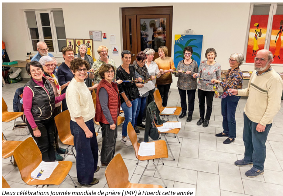
Deux célébrations Journée mondiale de prière (JMP) à Hoerdtd cette année

Parce qu'on ne peut pas inaugurer la placette Heyler et ne pas s'engager pour protéger la nature et la vie sur terre, les catéchumènes - toutes années confondues - se sont mobilisés le samedi 7 mars pour participer au Nettoyage de printemps du ban communal de Hoerdtd. Une expérience pleine d'enseignement, mais aussi de rires. Merci aux adultes qui les ont entourés toute la matinée.