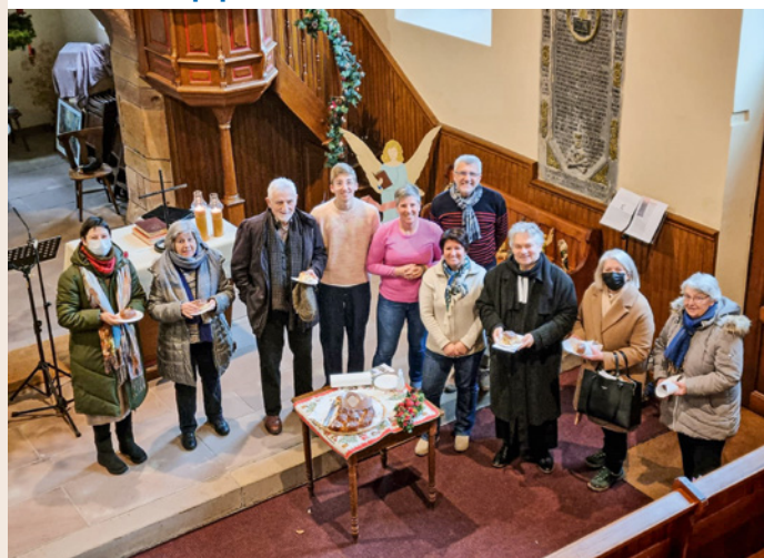
Le partage de la galette des rois a eu lieu après le culte de l'Épiphanie du 11 janvier.