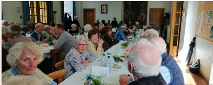
Les convives qui ont dégusté des délicieuses bouchées à la reine préparées par le traiteur Specht.