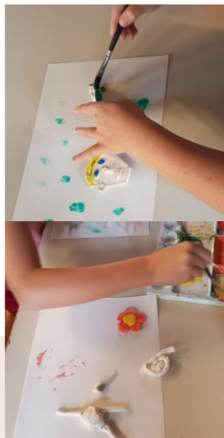
L'école du dimanche a eu lieu le 22 octobre à Eckwersheim.