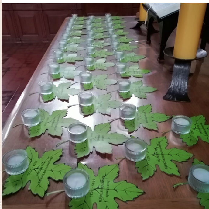
Lors du culte du 16 novembre, nous nous sommes souvenus des 35 personnes qui nous ont quittés au cours de cette année liturgique.