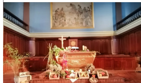
À Brumath, le culte des récoltes a eu lieu le 19 octobre.