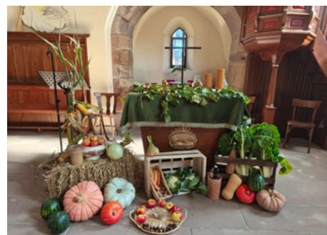
À Eckwersheim, le culte des Récoltes a eu lieu le 12 octobre